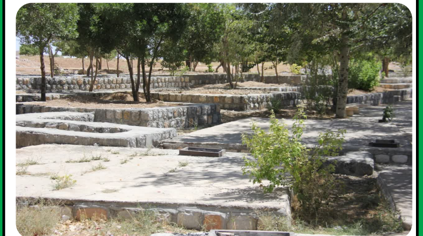
اجرای سکوهای جدید در مجتمع تفریحی گرداب