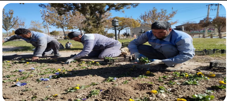
کاشت گل های فصلی در ورودی شهر