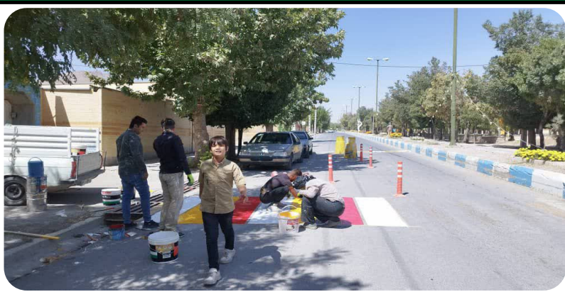
خط کشی عابر پیاده معابر سطح شهر