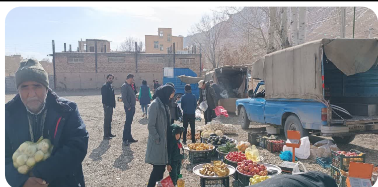
راه اندازی بازار روز (پنجشنبه بازار) بعد از سه سال وقفه، جهت رفاه حال همشهريان