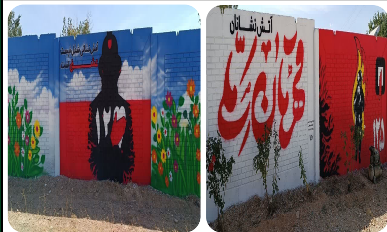
نقاشی و دیوار نگاری در سطح شهر