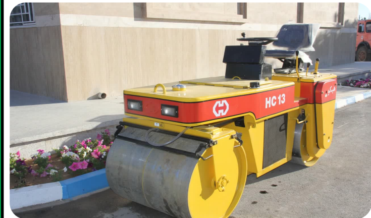
خرید ۳ دستگاه خودروی عمرانی