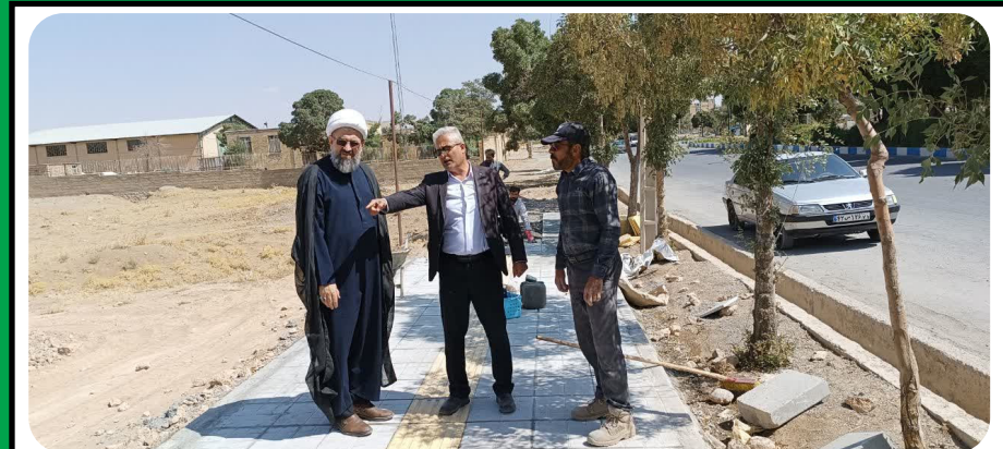
بازدید شهردار و امام جمعه شهر بن از اجرای پروژه پیاده روی سلامت