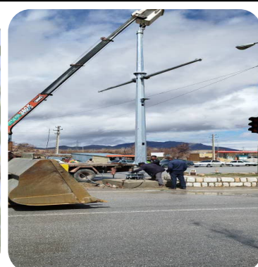
نسب پایه ها و دوربین های پایش تصویری