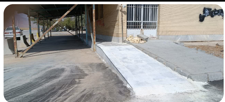
مناسب سازی ورودی غصالحانه آرامستان باغ رضوان