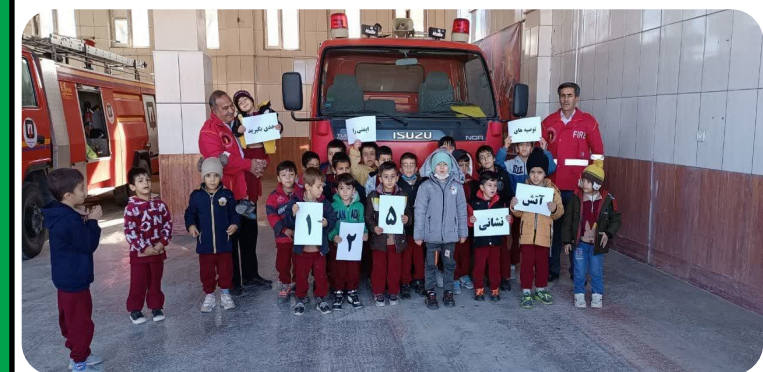
برگزاری کلاسهای آموزشی اطفای حریق برای نونهالان و دانش آموزان

اطفاء حریق مسکونی ۳۵ مورد. اطفاء حریق باغ و مزارع ۴۰ مورد. اطفاء حریق خودرو ۲۰ مورد. اطفاء حریق مکان های تجاری ۱۵ مورد . به دام انداختن حیوانات وحشی ۴۰ مورد. رهاسازی و امداد از چاه و قنوات ۱۰ مورد. رهاسازی و نجات از داخل آسانسور ۵ مورد . حوادث جاده ای شامل تصادفات ۴۰ مورد . برش و رهاسازی دست از داخل انگشتگر و چرخ گوشت ۱۲ مورد. نجات غریق از رودخانه و استخر مزارع ۱۱ مورد . برگزاری کلاس های فرهنگ سازی ایمنی و اقدامات اولیه آتش سوزی در سطح شهرستان و ادارات و مدارس ۳۶ مورد . اعزام نیرو به حوادث چهارشنبه آخر سال چهارشنبه سوری ۲۸ مورد. بازدید از مکان های اداری ، تجاری و مسکونی جهت تأیید آتش نشانی ۲۱ مورد.