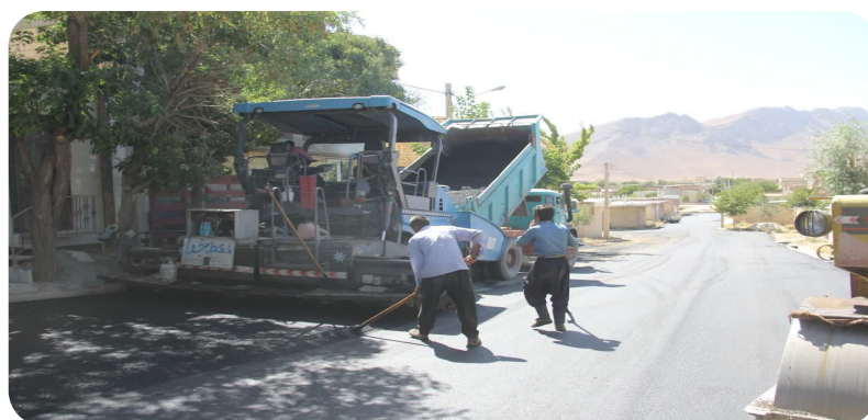
اجرای آسفالت کوچه‌های بین خیابان ملت و مدرس