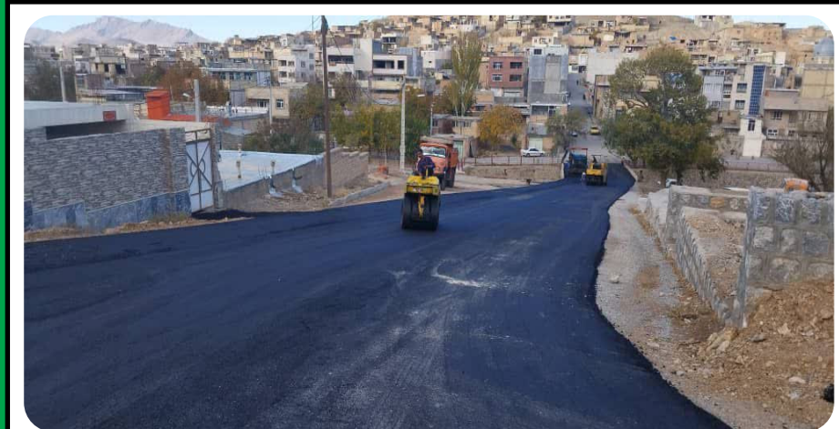
اجرای آسفالت خیابان منتهی به خیابان جانبازان