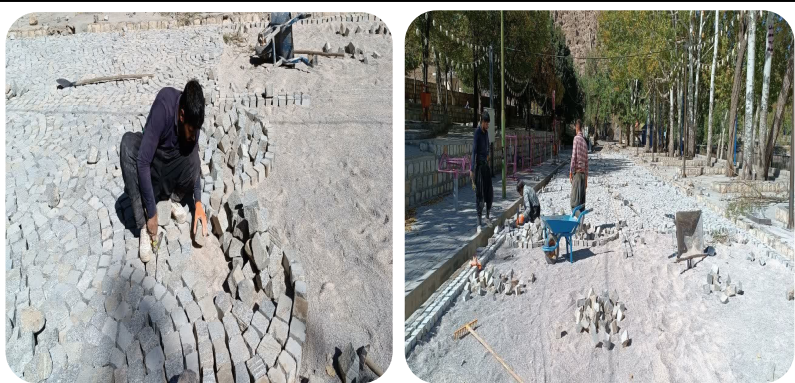
اجرای پروژه سنگ فرش مجتمع تفریحی گرداب