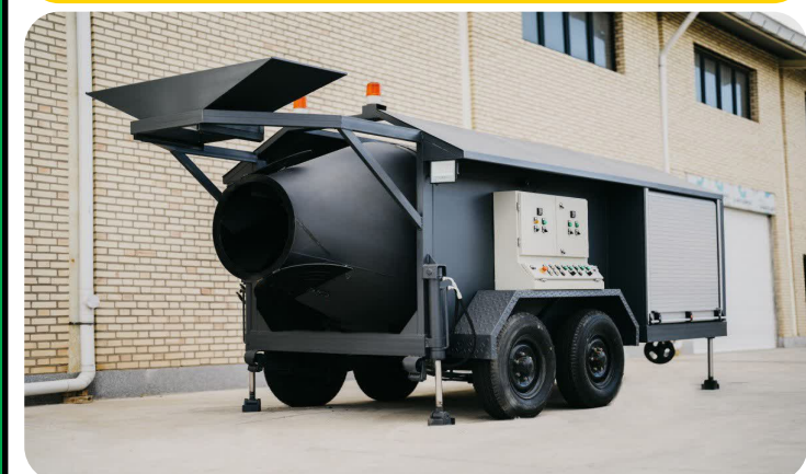
خرید یک دستگاه کارخانه آسفالت سیار جهت اجرای آسفالت معابر سطح شهر