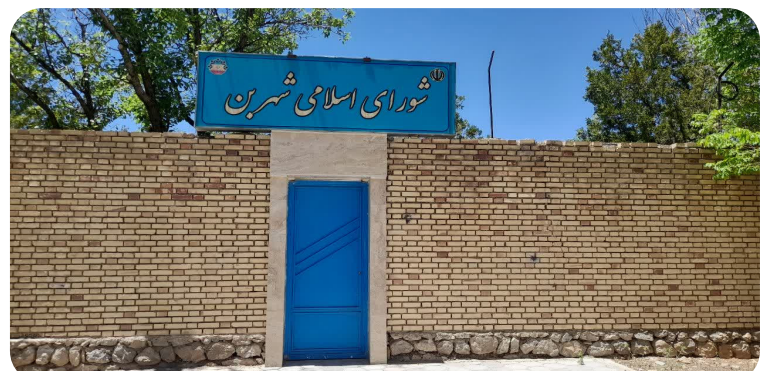
ساخت و تکمیل ساختمان اداری شورای اسلامی شهر برای اولین بار