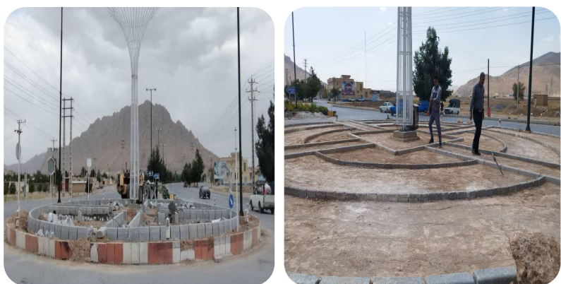
پروژه ی اصلاح هندسی و محوطه سازی و فضای سازی میدان شهدا