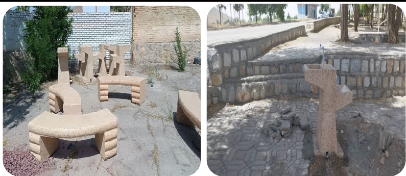
خرید و نصب نیمکت و آبخوری در بوستان ها و مجتمع تفریحی گرداب