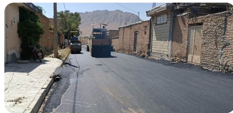
اجرای پروژه آسفالت کوچه‌های خیابان پاسداران