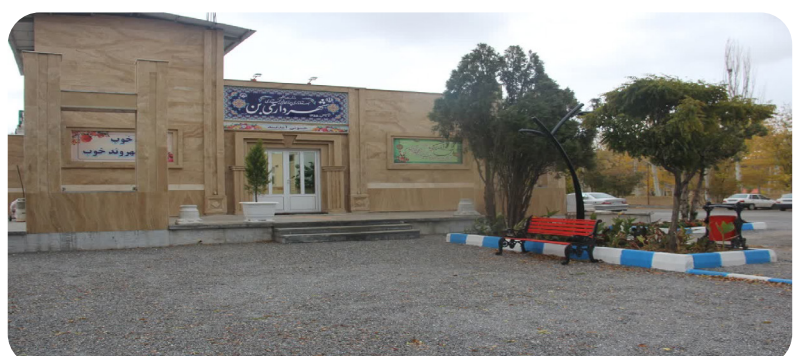
احداث ساختمان جدید شهرداری