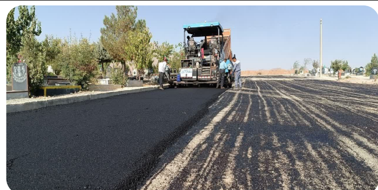
اجرای پروژه آسفالت آرامستان باغ رضوان