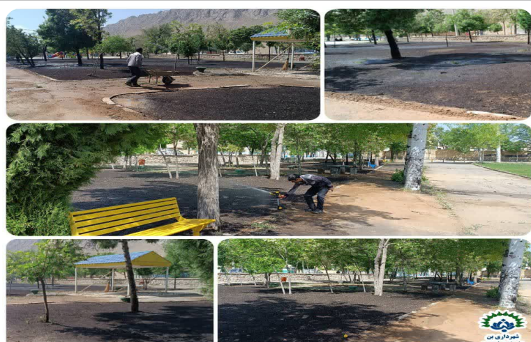
چمن کاری پارک ملت