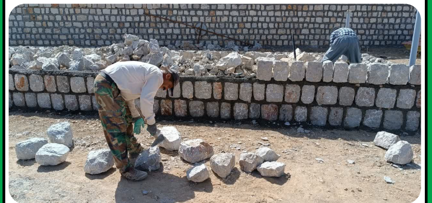
اجرای جایگاه سن در مجتمع گرداب جهت برنامه‌های فرهنگی و هنری