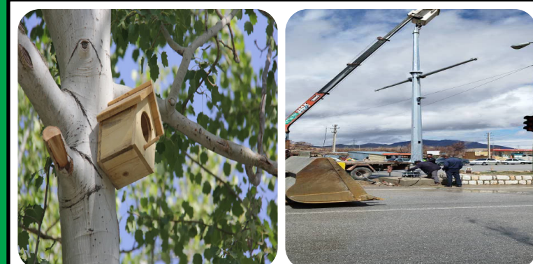
تهیه ، ساخت و نصب لانه پرندگان در مجتمع گرداب