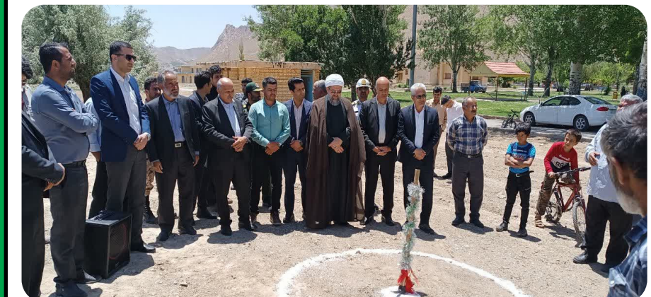
کلنگ زنی فاز اول پروژه پارک بانوان