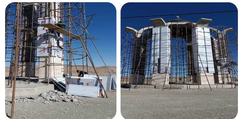
مشارکت در اجرای یادمان شهدای گمنام