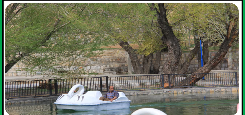
قایق‌رانی گرداب بن