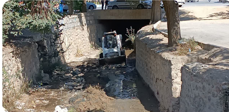
لاپروبی مسیل اصلی شهر بن