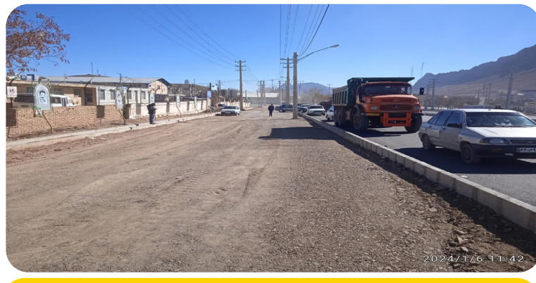
اجرای پروژه بلوار ورودی شهر از سمت داران