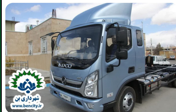
خرید یک دستگاه خودرو نیمه سنگین آرنای پلاس برای واحد نقلیه و موتوری