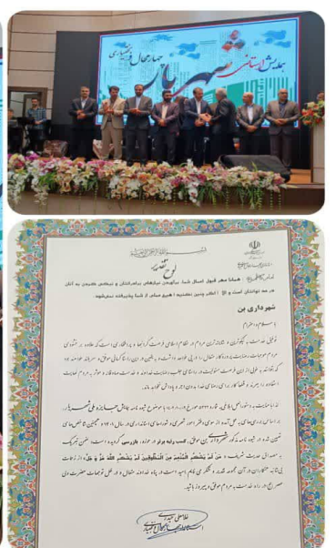
کسب جایزه ملی شهریار در استان توسط شهرداری بن